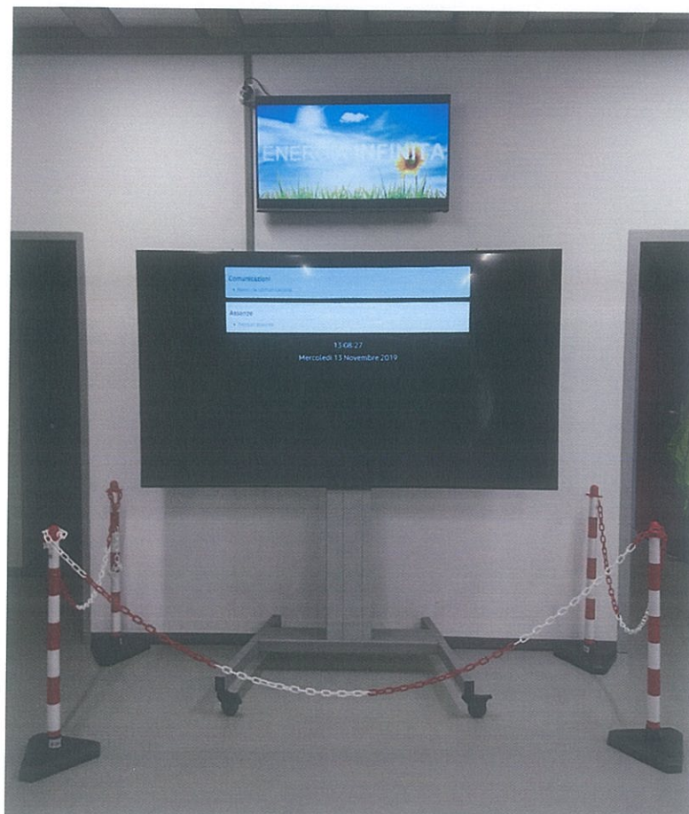
Quando non ci sono comunicazioni