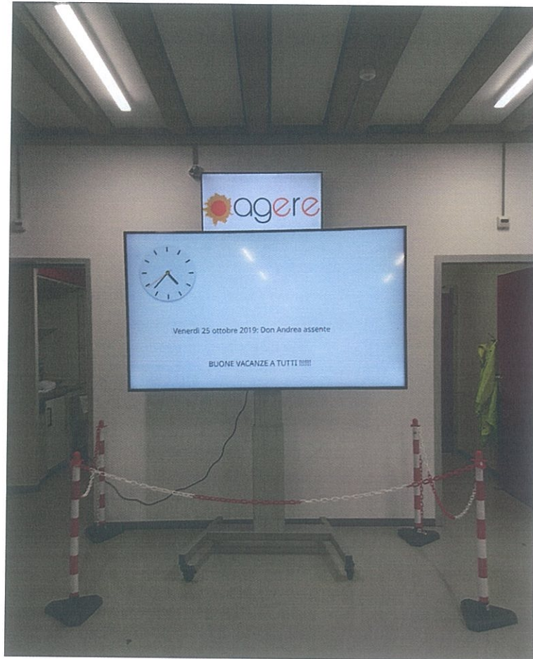
Primo esempio di utilizzo