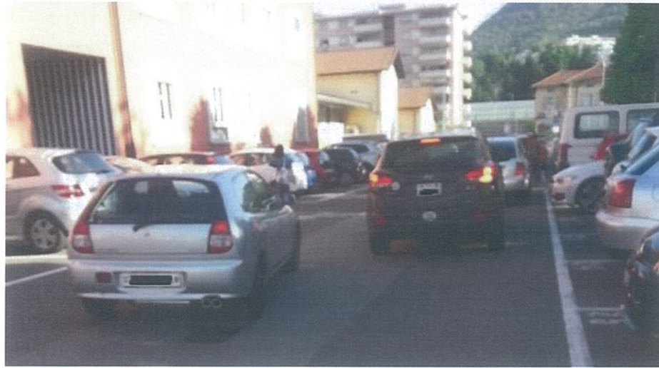
Auto in sosta per far scendere bambini, pedone che percorre la strada