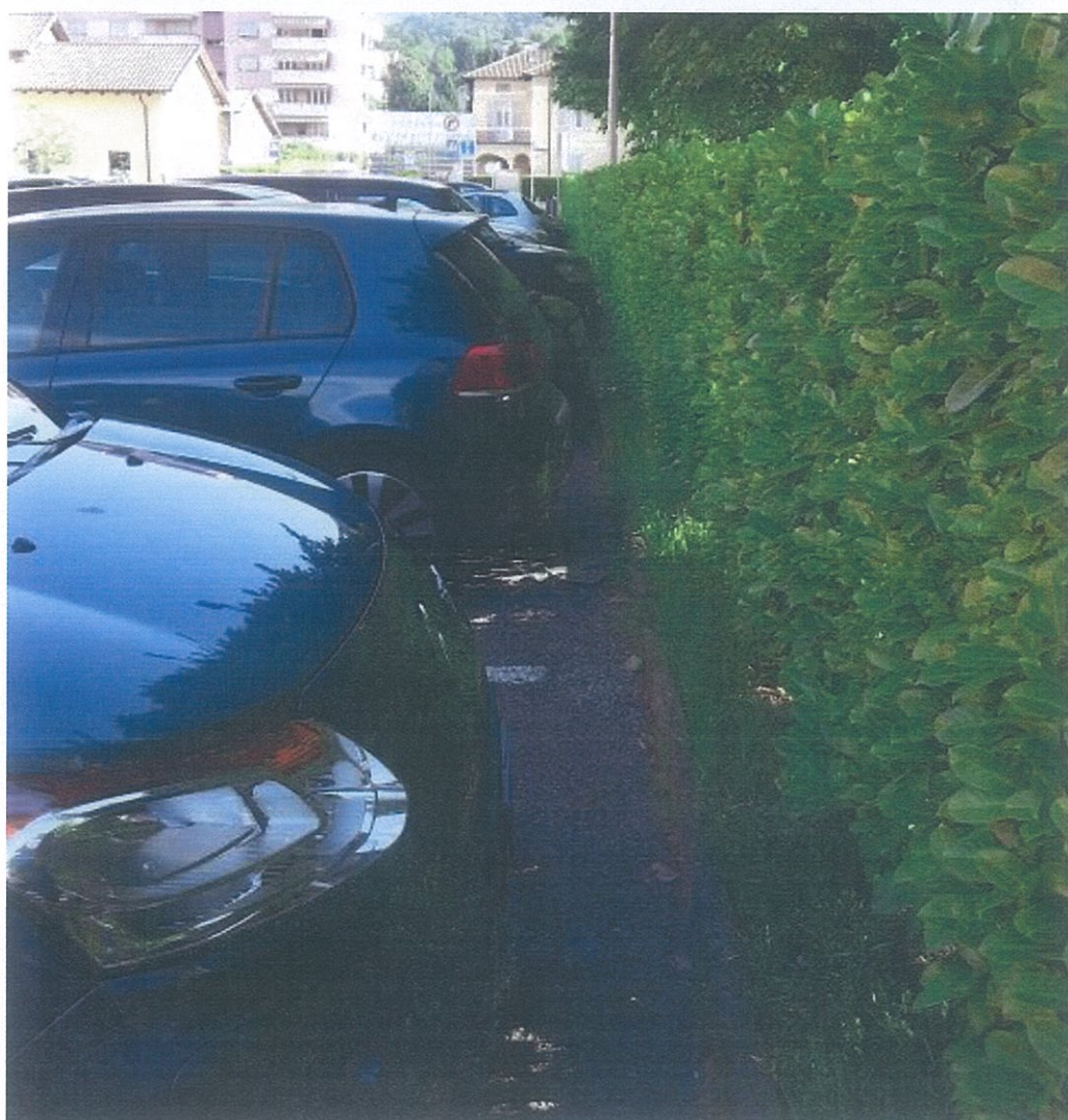
Con appositi distanziatori ci sarebbe un passaggio sicuro lungo la siepe